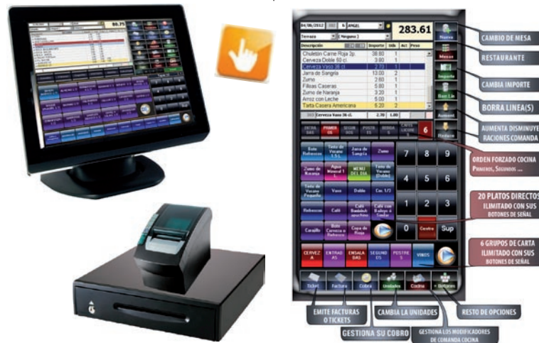
Venta mas Cómoda

La aplicación se adapta a las capacidades de cada sistema y posibilidades económicas de cada empresa, puede ser instalado, en un ordenador personal con su monitor y teclado o en una red de terminales táctiles e impresoras de cocina, ofreciendo un resultado óptimo en todos los casos.